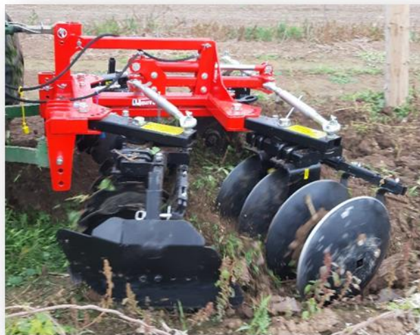
Přiorávací a odorávací disky Quivogne PXVI