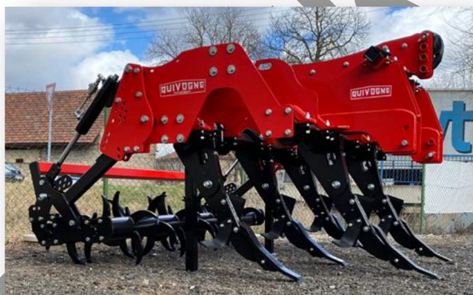
Dlátový pluh Quivogne SSDR M 5/200