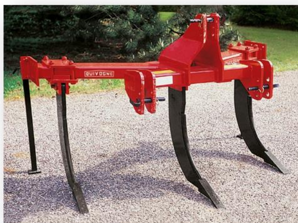
Podrývák Quivogne SL3