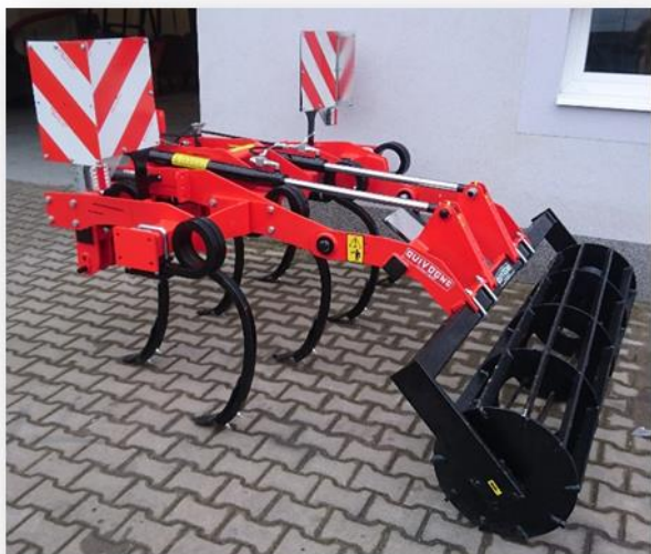
Radličkový kypřič Quivogne Bulltech 7 R